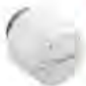
■ FJVR, 自力式回水温度限制传感器