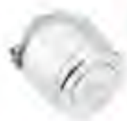
■ FJVR, 自力式回水温度限制传感器