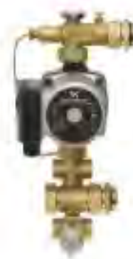
FHM-C6, 供给电压为230V, 配有格兰富UPS 15-60三速泵, 供水温度控制器18-52℃, 供水温度计及内置单向阀。