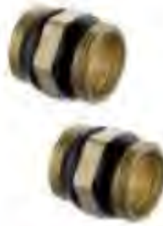
■ FHF-C, 连接件, 1"