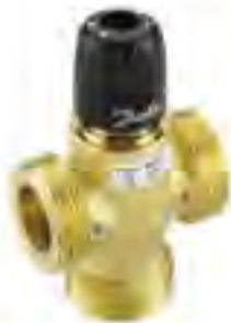
■ TVM-H, 自力式三通恒温混水阀