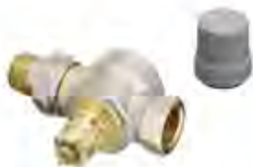
■ RA-G 阀门