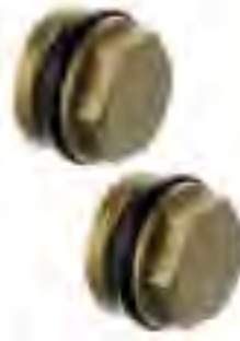
■ FHF-E, 分水器堵头