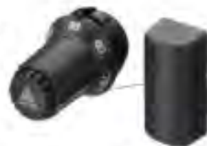
■ RA-C, 温控阀体，与FTC自力式温度控制器配套使用