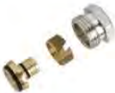
■ 用于PEX, PB, PPR 等塑料管