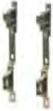
■ FHF-MB, 分水器 安装支架