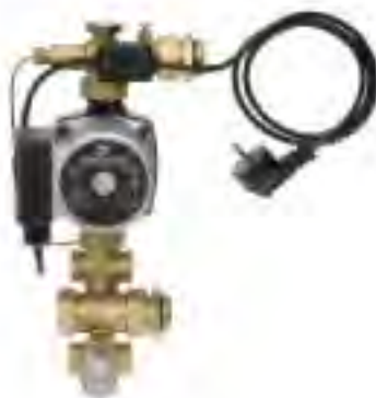
FHM-C5, 供给电压为230V, 配有格兰富UPS 15-40三速泵, 供水温度控制器18-52℃, 电子安全温控器(切断温度55℃±4K), 供水温度计及内置单向阀。