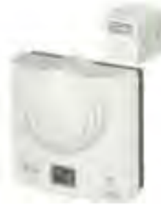
■ CETB-RF 无线式水罐温度开关