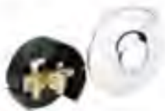
■ FHV-R 墙体安装套装