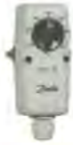
■ ATP 管道温度开关