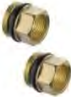
■ FHF-R, 变径, 将1"内螺纹 变成3/4"内螺纹